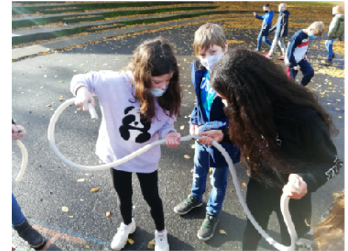
Teamgeist und Kooperation beim Murmeltransport