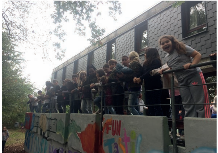
Klasse 5b in Lindlar

lenkarten mit verschiedenen Aufgaben versteckt. Dann mussten wir würfeln und im gesamten Außengelände die Karte finden, die zu unserer gewürfelten Zahl passte. Hatten wir sie gefunden, mussten wir zu den Paten laufen und ihnen das Wort und die Zahlen sagen. Daraufhin wurde uns die zugehörige Knobel- oder Sportaufgabe gestellt, die wir lösen mussten, bevor wir wieder würfeln durften. Auf jeden Fall hat es uns allen Spaß gemacht und wir waren sehr glücklich.